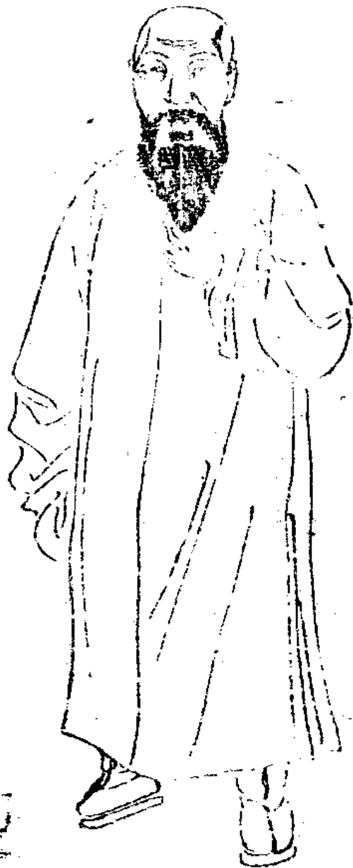
白下段鏡江敬繪像