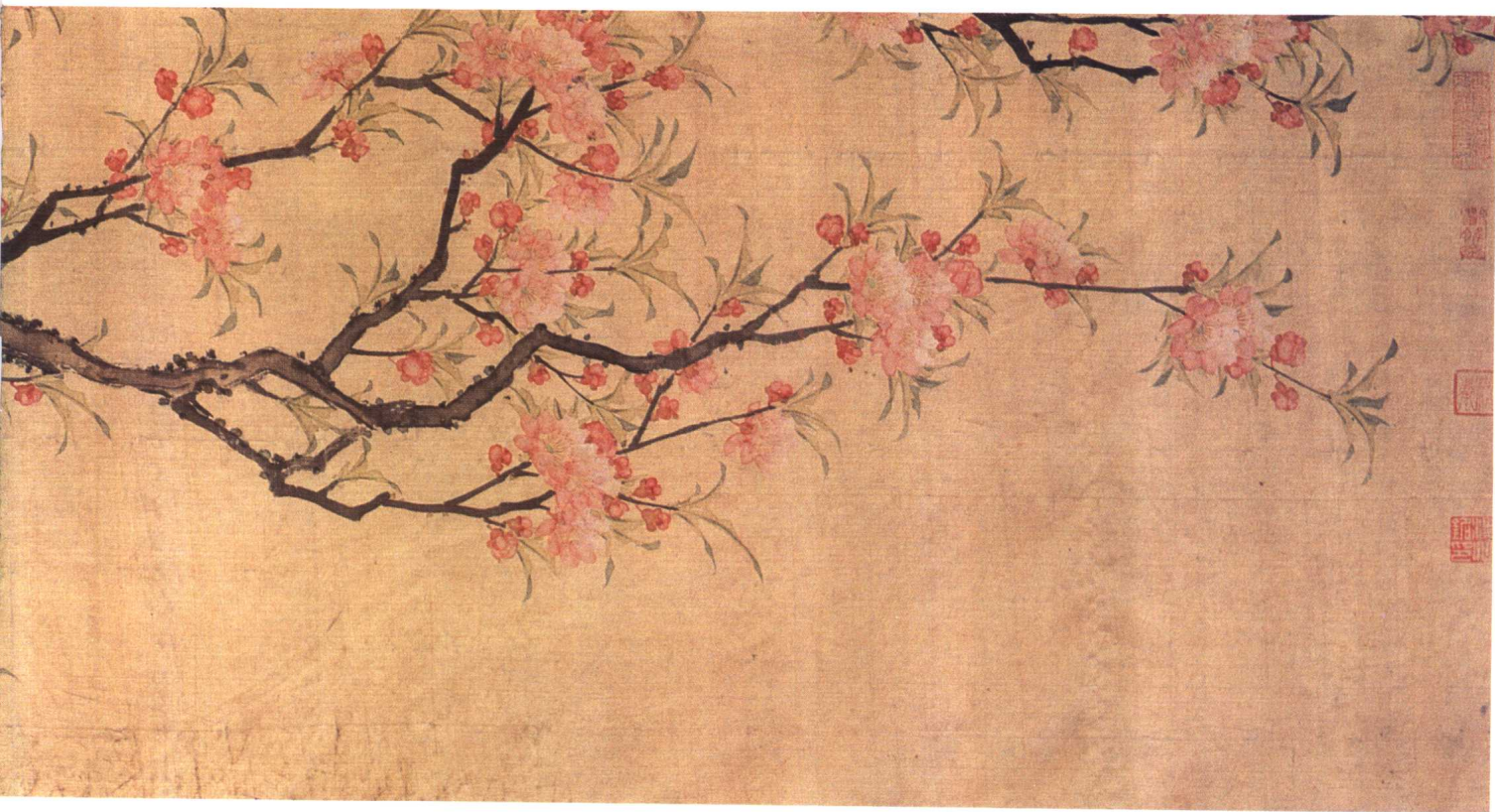
八 清 蔣廷錫 花卉圖卷 絹本 39×146 厘米