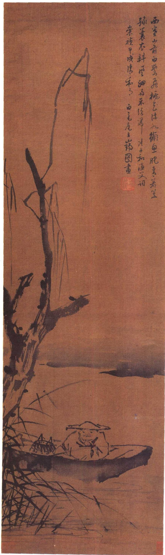
五明 張瑞圖 漁父圖軸 絹本 31×102 厘米