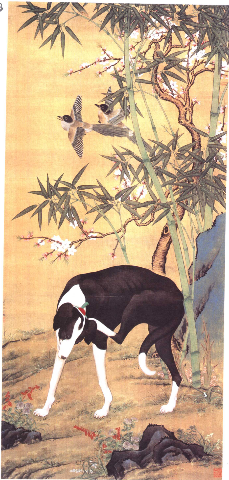
一〇 清郎世寧 工筆圖軸 絹本 93×179 厘米