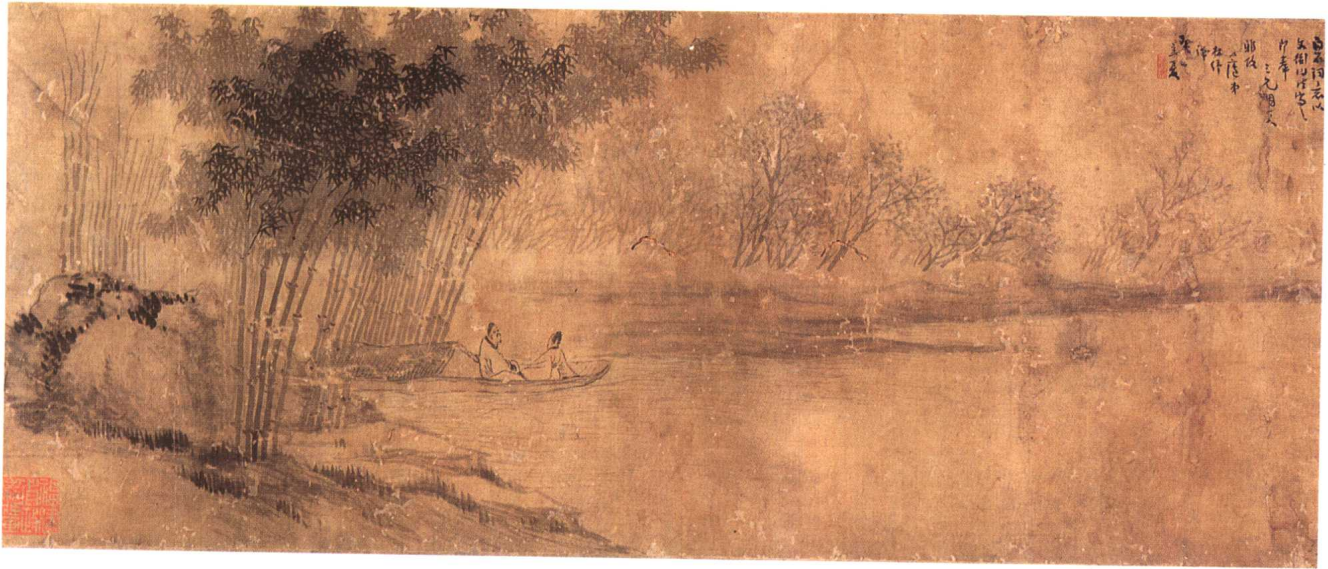
二二 近代 林 紓 山水圖卷 絹本 31×74 厘米