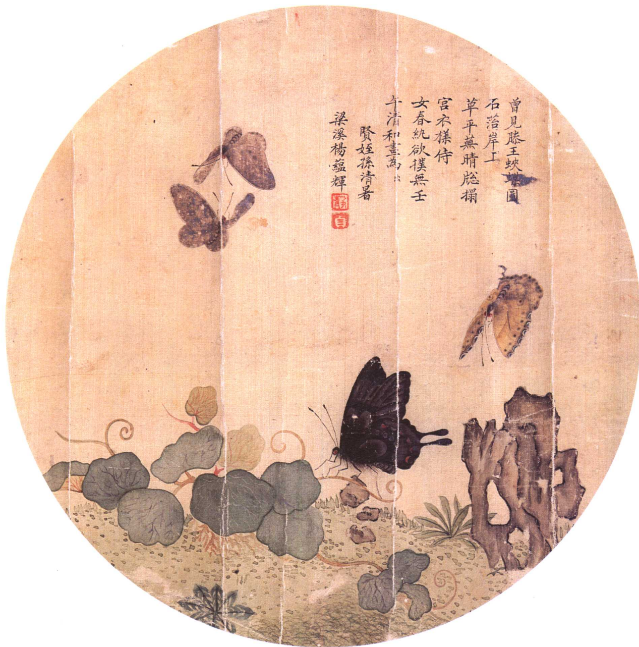
二〇 清 楊蘊輝 蛺蝶圖團扇 絹本