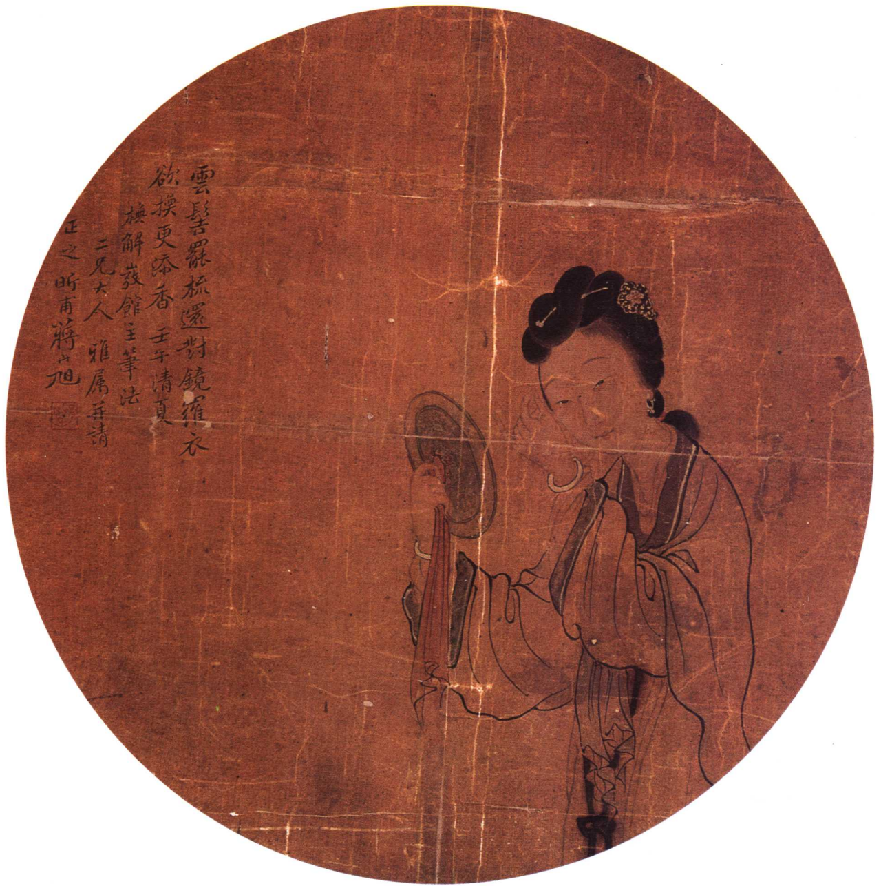
二一 清 蔣山旭 美女圖團扇 絹本