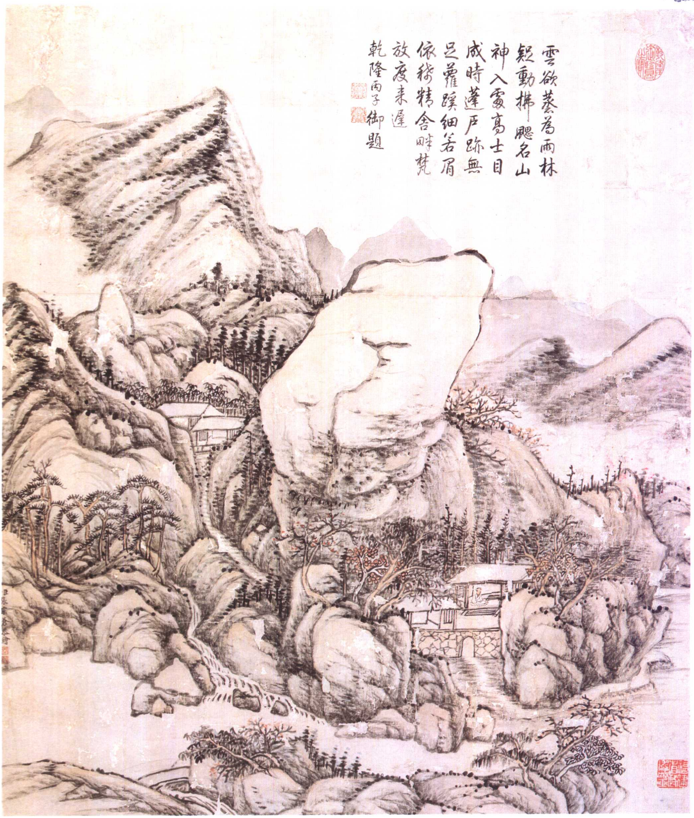
九清 張宗蒼 山水圖軸 紙本 76×89 厘米