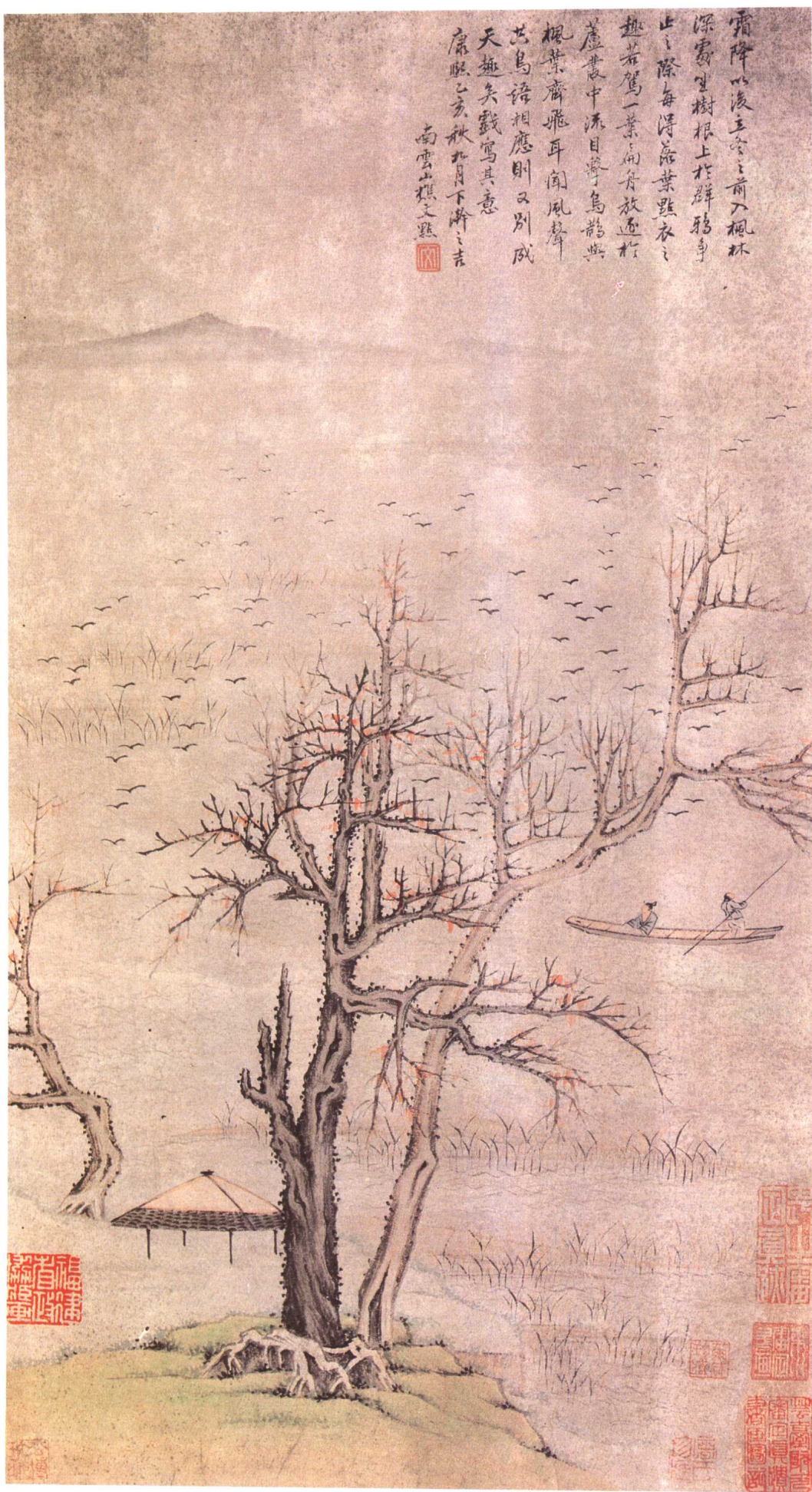
六明文點 山水圖軸 紙本 36×67厘米

霜降以後至冬之前入楓林 深處坐樹根上於群鴉身 止之際每得落葉點衣之 趣若駕一葉扁舟放逐於 蘆葦中流目擊于鳥鵲與 楓葉齊飛耳聞風聲 出鳥語相應則又別成 天趣矣戲寫其意 康熙乙亥秋九月下泚之吉 南雲山樵文題