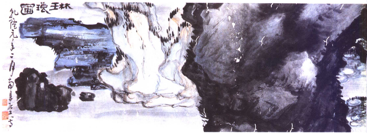
一二 清 南阜居士 琳琅圖卷跋二 紙本 36×140 厘米