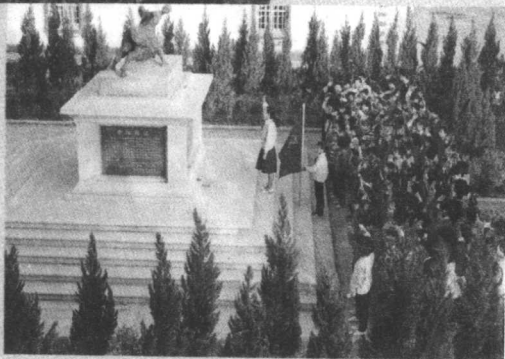
▷集美中 学少先队举行 学习李林诗歌 朗诵会。