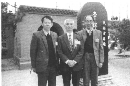
▷会后,与原全国侨联主席庄炎林在李林烈士千古碑前合影留念。