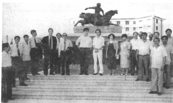
◁1989 年香港集美 校友会代表 参加省国际 贸易洽谈会 时回母校参 观建造中的 李林园。