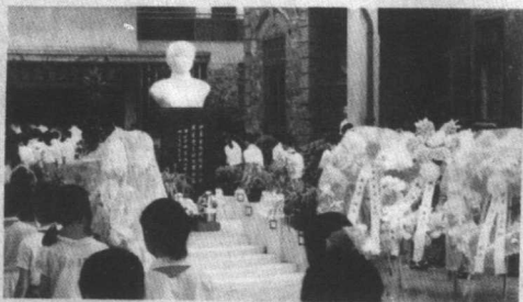
◁上海爱国中学李林塑像揭幕仪式。