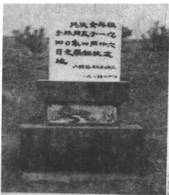
△李林壯烈牺牲处碑记。