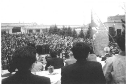
◁1985年4月26日,在平鲁区烈士陵园隆重举行抗日民族女英雄李林烈士殉国55周年纪念大会。