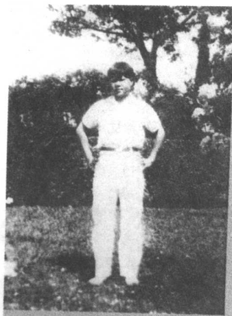
◁在上海爱国女中的留影。