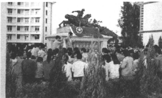
◁集美中新 组织李林铜 像前举行入 团宣誓。