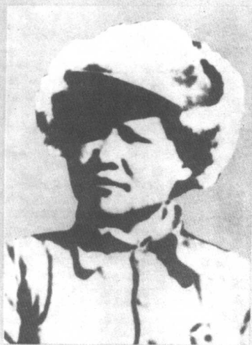
▷在抗日前线李林的戎装照。