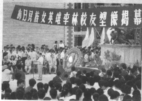
◁集美中学校庆70周年隆重举行李林铜像揭幕仪式。