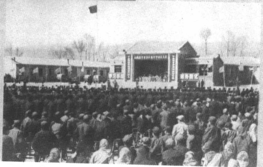
▷平鲁县李林 中学命名大会。