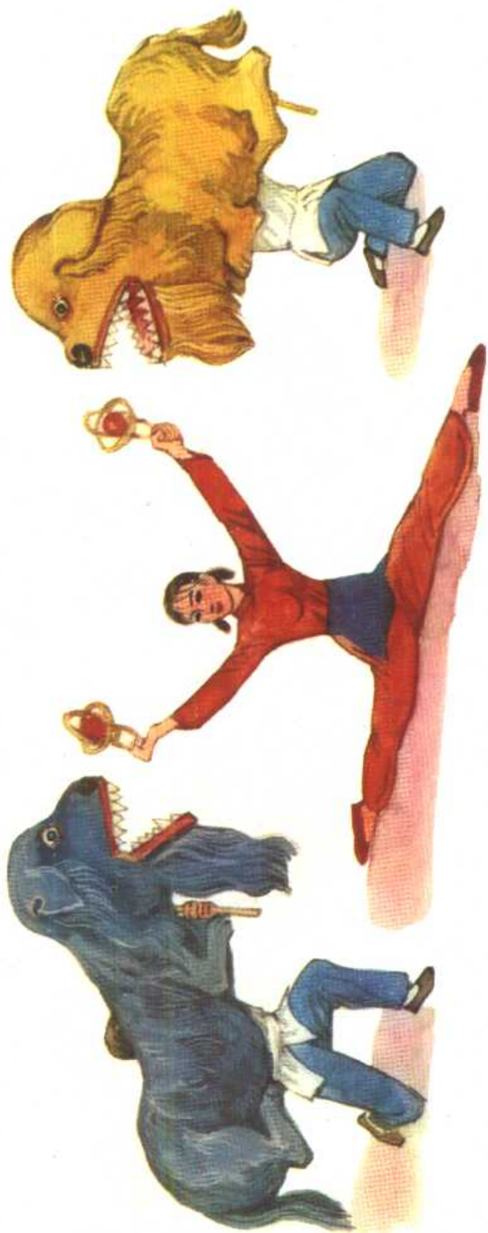
手摇狮造型设计及演员服装