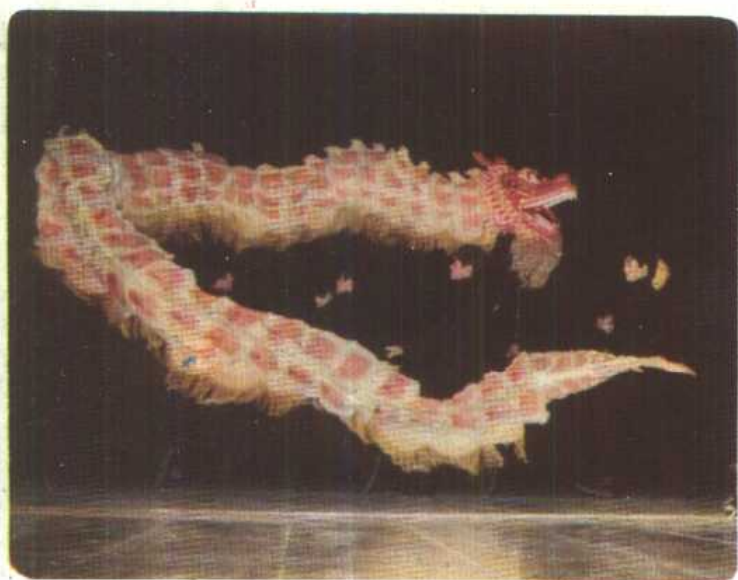
江西省杂技团供稿