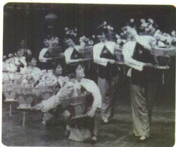
洪都机械厂产品检验科演出