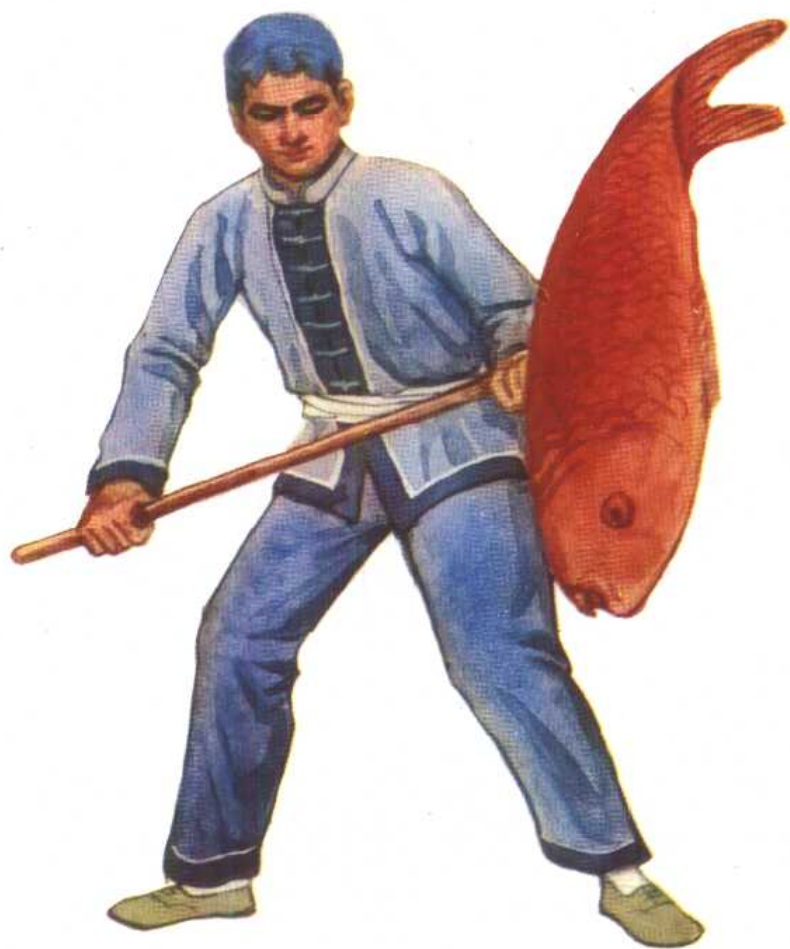
鲤鱼灯服装及道具