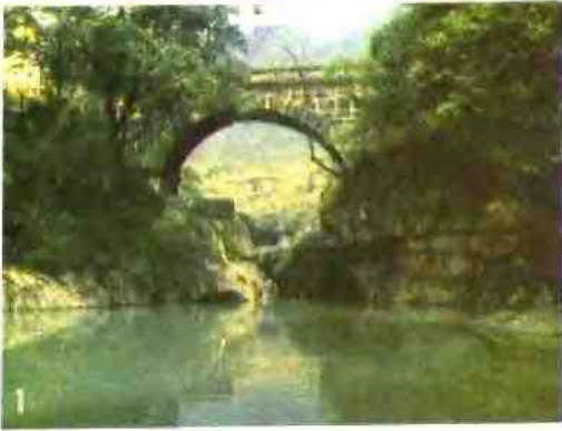
1 庐山观音桥 2 庐山白鹿书院 3 文天祥墓 4 南昌青云谱