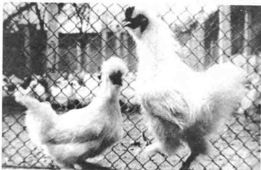
1 2 泰 安 和 源 武 总 山 平 鸡 巷