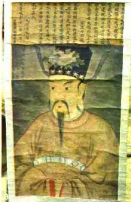
1 庐山含鄱口 2 吉州窑彩罐 3 欧阳修像 4 景德镇名瓷