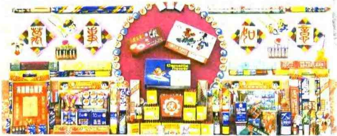
1 采茶戏 2 万载牡丹亭 3 龙尾爆碾