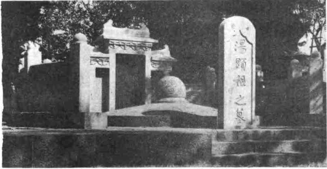
1 2 汤 湖 显 口 祖 石 墓 钟 山