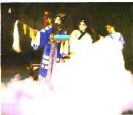
1 南昌八一起义纪念馆 2 彭泽龙宫洞 3 井冈山—茨坪 4 赣剧《邯郸梦》剧照