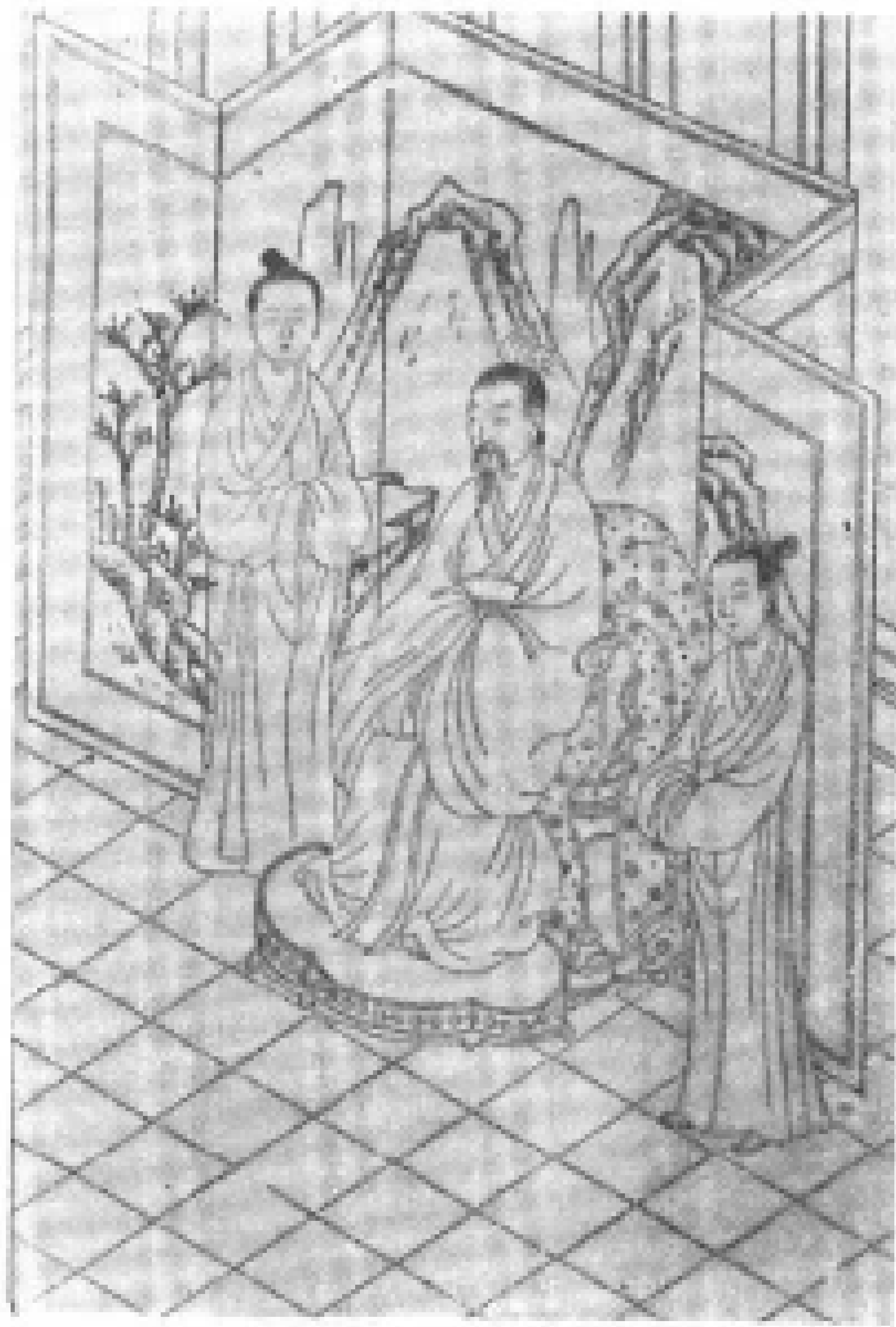
明仇英(十洲)繪“晏子見傷槐女圖” (知不足齋刊)