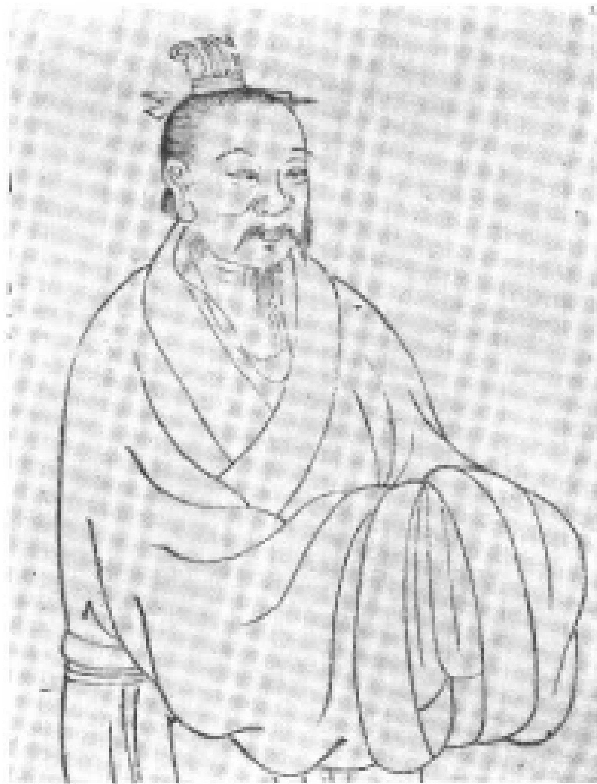
晏子像 (顧沅：古聖賢像傳)