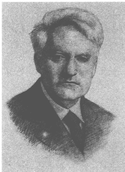
Cardozo (美) 卡多佐