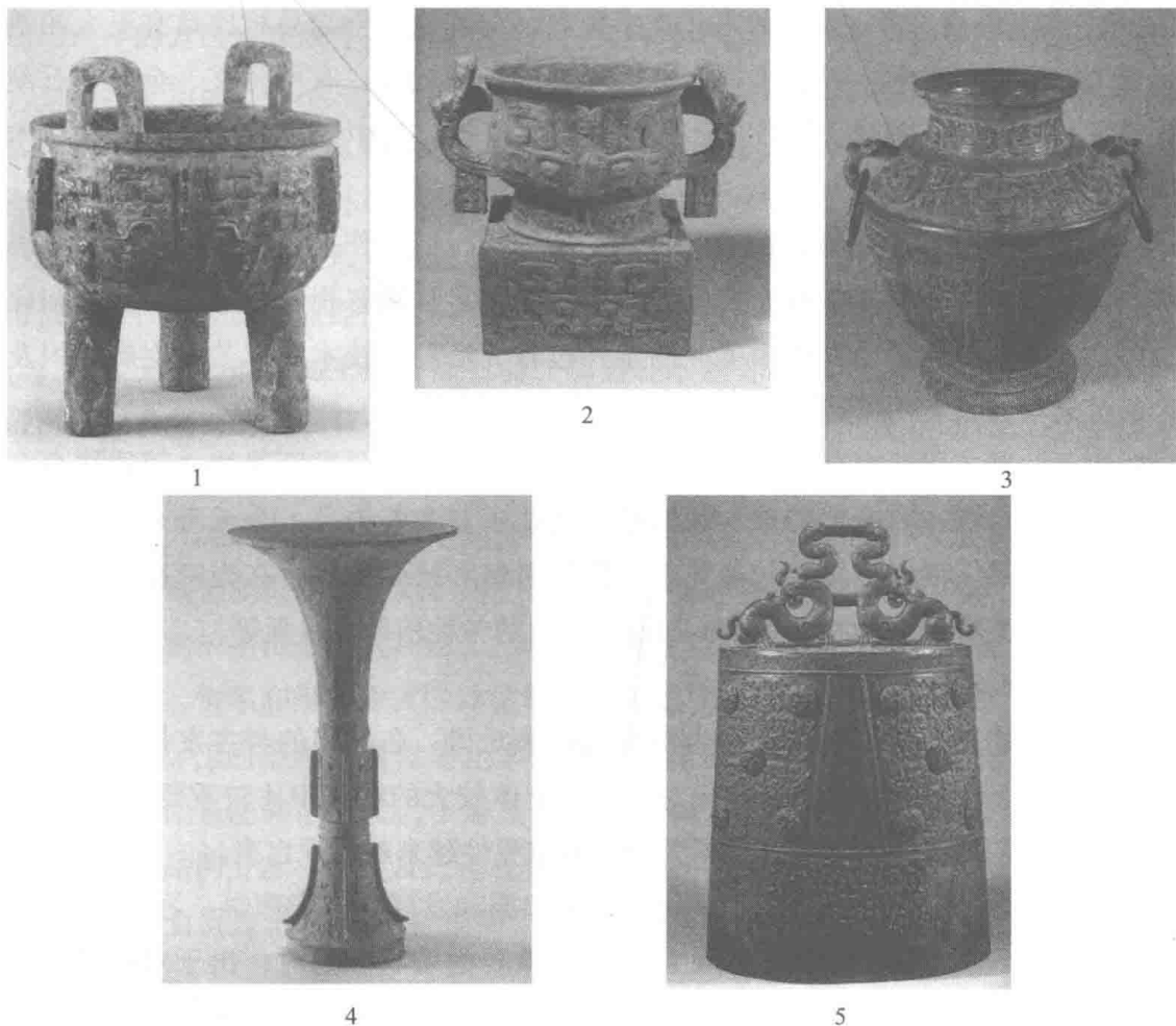
图2 商周时期的青铜礼乐器

3. 礼器和乐器。随着社会的分化和分层，产生了规范人们行为的礼制，而作为礼制载体的礼器应运而生。礼器和乐器产生于史前时期，商周两代达到一个高峰。礼乐器的质料随着时代的变化而有所不同。早期主要为陶器和玉器，进入青铜时代以后，青铜成为制作礼器、乐器和车马器的主要材料（图2），而玉器一直是礼器的重要组成部分。