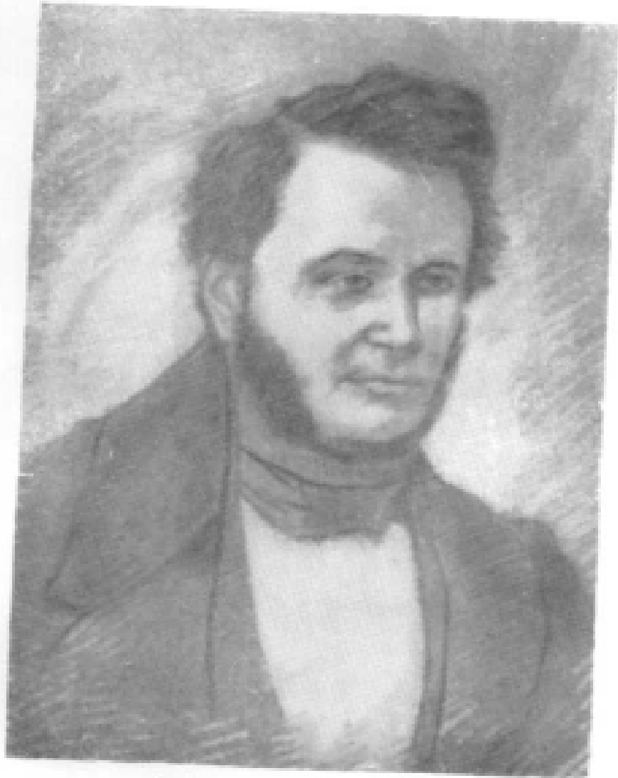
邦雅门·奥连德·罗德里格 (1794—1851)