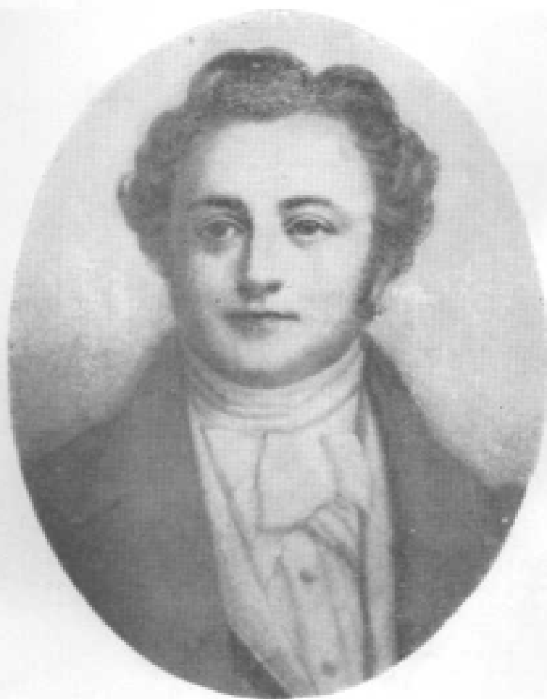
巴特勒米·普罗斯佩·安凡丹 (1796—1864)