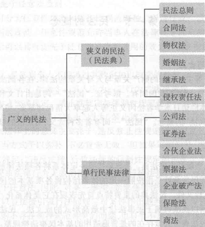
图 1-1 民法的类型

实质意义上的民法的特点在于:一方面,它是调整平等主体关系的法律规范,而并不注重外在的形式。尽管形式意义上的民法是最高形式的成文法,但毕竟不能涵盖民事生活的全部,还必须存在大量的置于其他法律、法规中的民法规范。另一方面,实质意义上的民法不限于法律、法规,还包括了大量的其他规范性文件和司法解释,所以实质意义上的民法在法源上意义更为宽泛。正是由于该原因,实质意义上的民法也被称为广义的民法。在我国,广义的民法是指所有调整民事关系的成文法和不成文法,涵盖了所有调整平等主体之间财产关系、人身关系和婚姻家庭关系的法律,包括民法总则、物权法、债和合同法、侵权行为法、知识产权法、婚姻法、继承法,以及公司法、证券法、保险法、海商法、票据法、破产法等,甚至包括行政法规中的民法性规范。