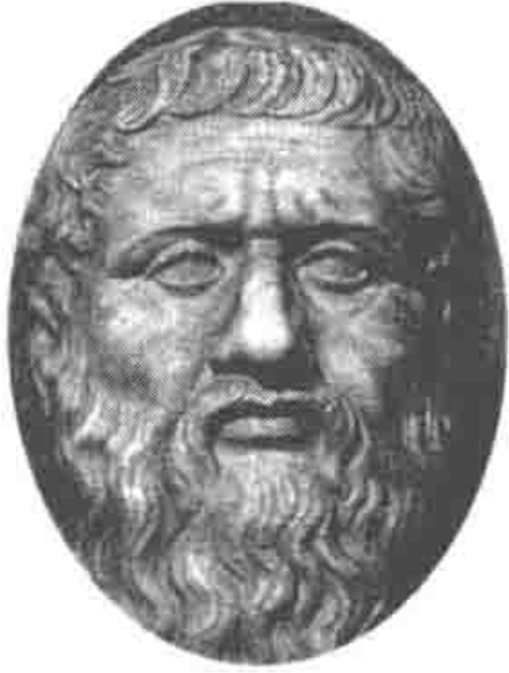
◀ 柏拉图 Plato