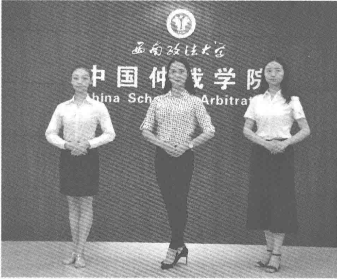
女士标准站姿示范