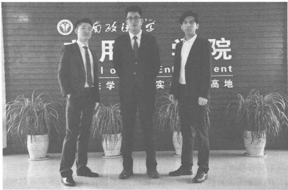
男士西装穿着示范 1)

穿西服一定要穿皮鞋,而且裤子宜盖住半个皮鞋鞋面。皮鞋应配上合适的袜子,一般宜穿深色袜,切忌穿白色或半透明的尼龙、涤纶丝袜。切忌西装搭配旅游鞋、轻便鞋、布鞋或露脚趾的凉鞋。