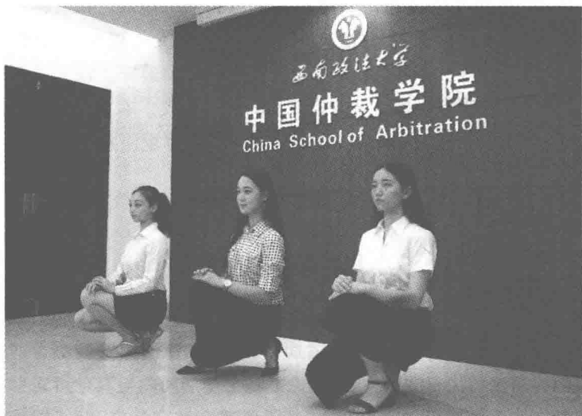
高低式、交叉式、半跪式蹲姿示范