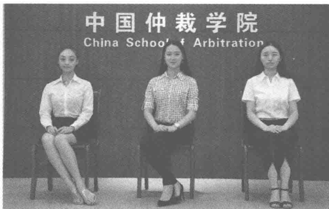
女士标准坐姿示范

坐姿之外,入座的动作也很重要。入座时,应款款走到座位前:如果是从椅子后面靠近椅子,应从椅子的左边走到座位前,背向椅子,右脚稍向后撤,使腿肚贴到椅子边,上体正直,轻稳坐下。女士入座时,应整理一下裙边,将裙子后片向前拢一下,以显得端庄娴雅。