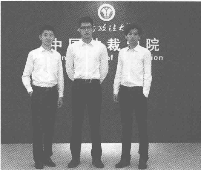
男士标准站姿示范