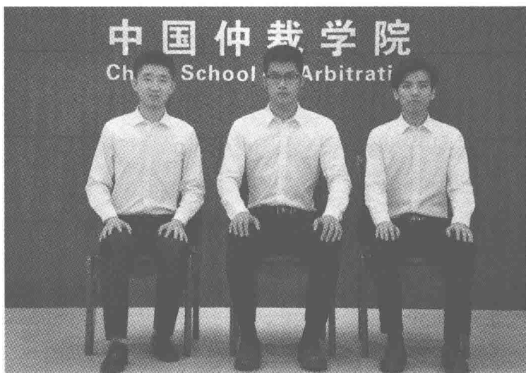
男士标准坐姿示范