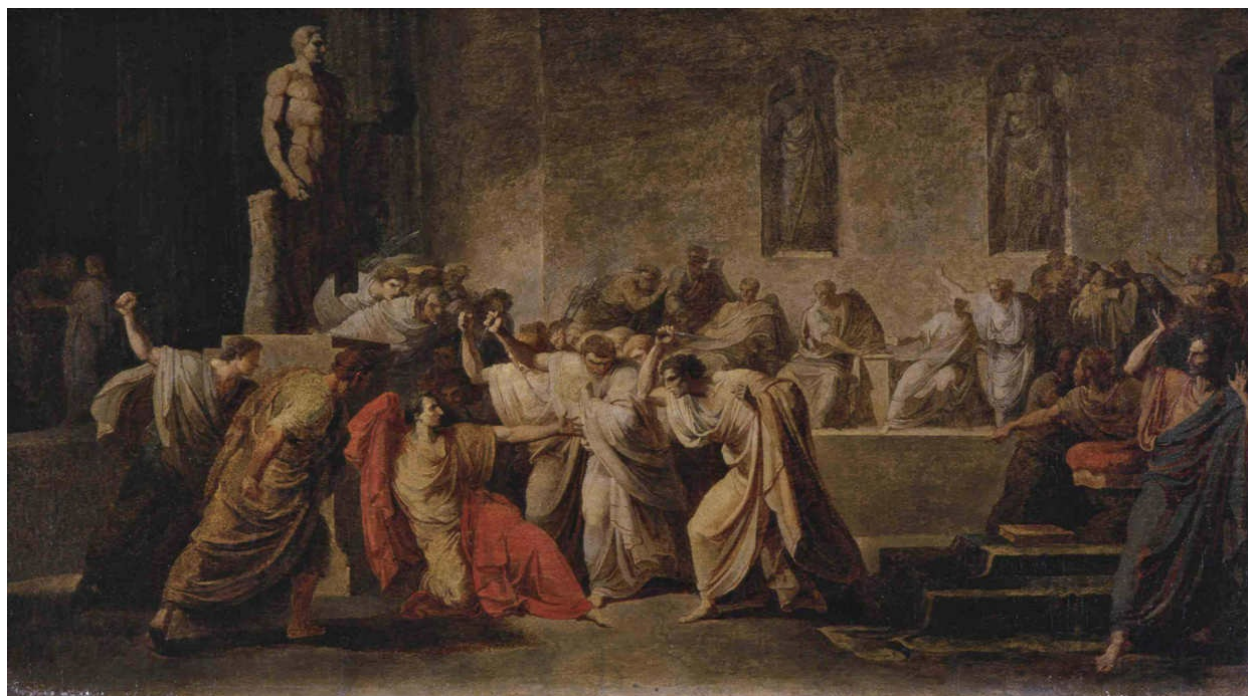
《尤利乌斯·恺撒之死》，Vincenzo Camuccini, 1804~1805。（National Gallery of Modern Art, Rome）

这尊帝国时期的雕像展现的是理想化的恺撒。从奥古斯都开始，历代皇帝对于应当赞颂恺撒的哪些方面都是经过精挑细选的。在元首制帝国时期，加图和布鲁图斯在元老当中仍然受到广泛仰慕。