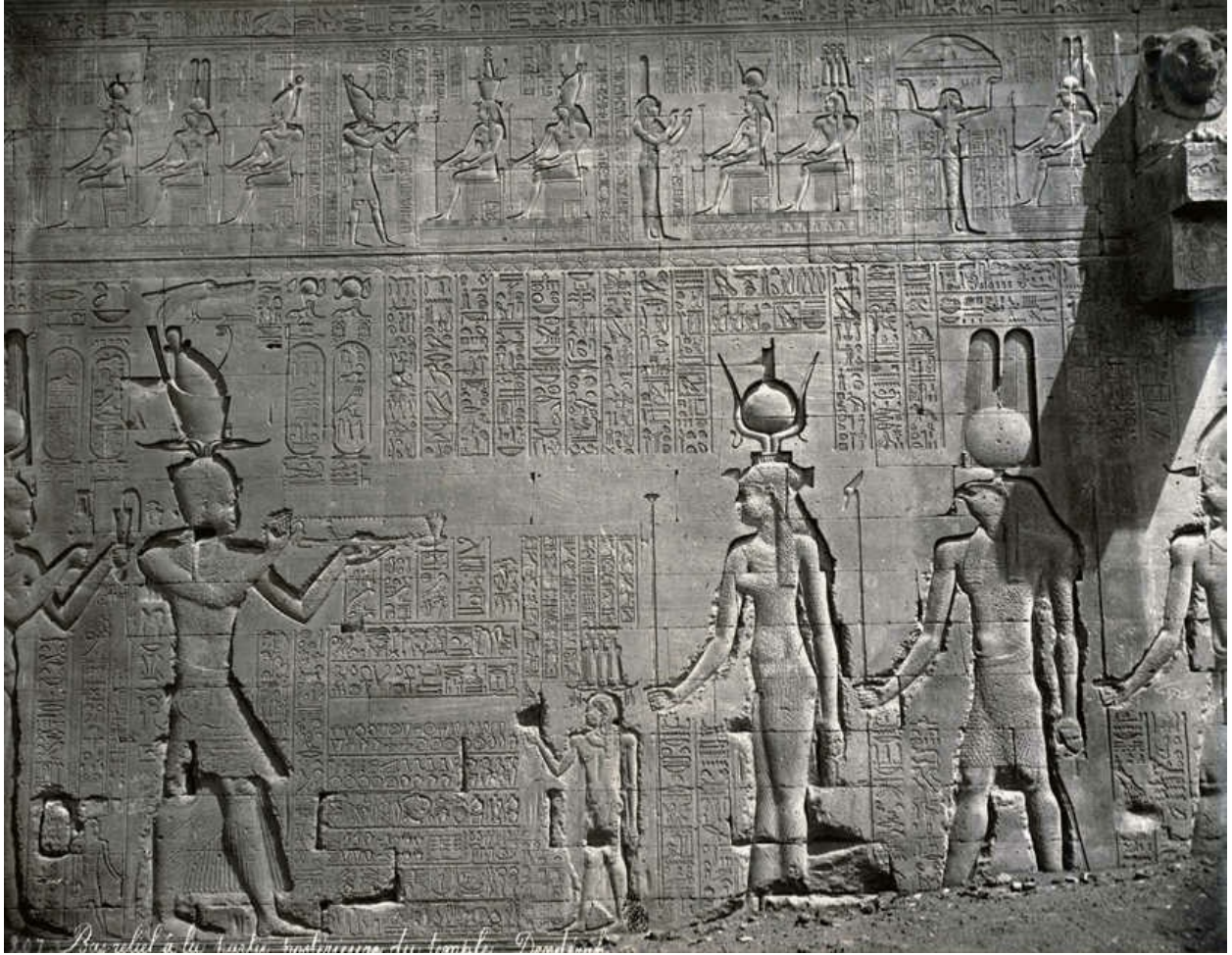
丹达拉的哈索尔神庙内的巨大浮雕表现的是克利奥帕特拉七世和儿子恺撒里昂（右侧）向诸神（左侧）献祭。