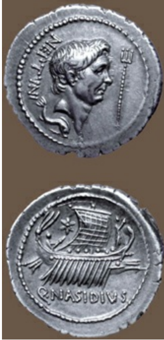
罗马迪纳厄斯银币，公元前 44 ~前 43 年，正面为“伟大的”庞培，反面为航行中的划桨帆船。