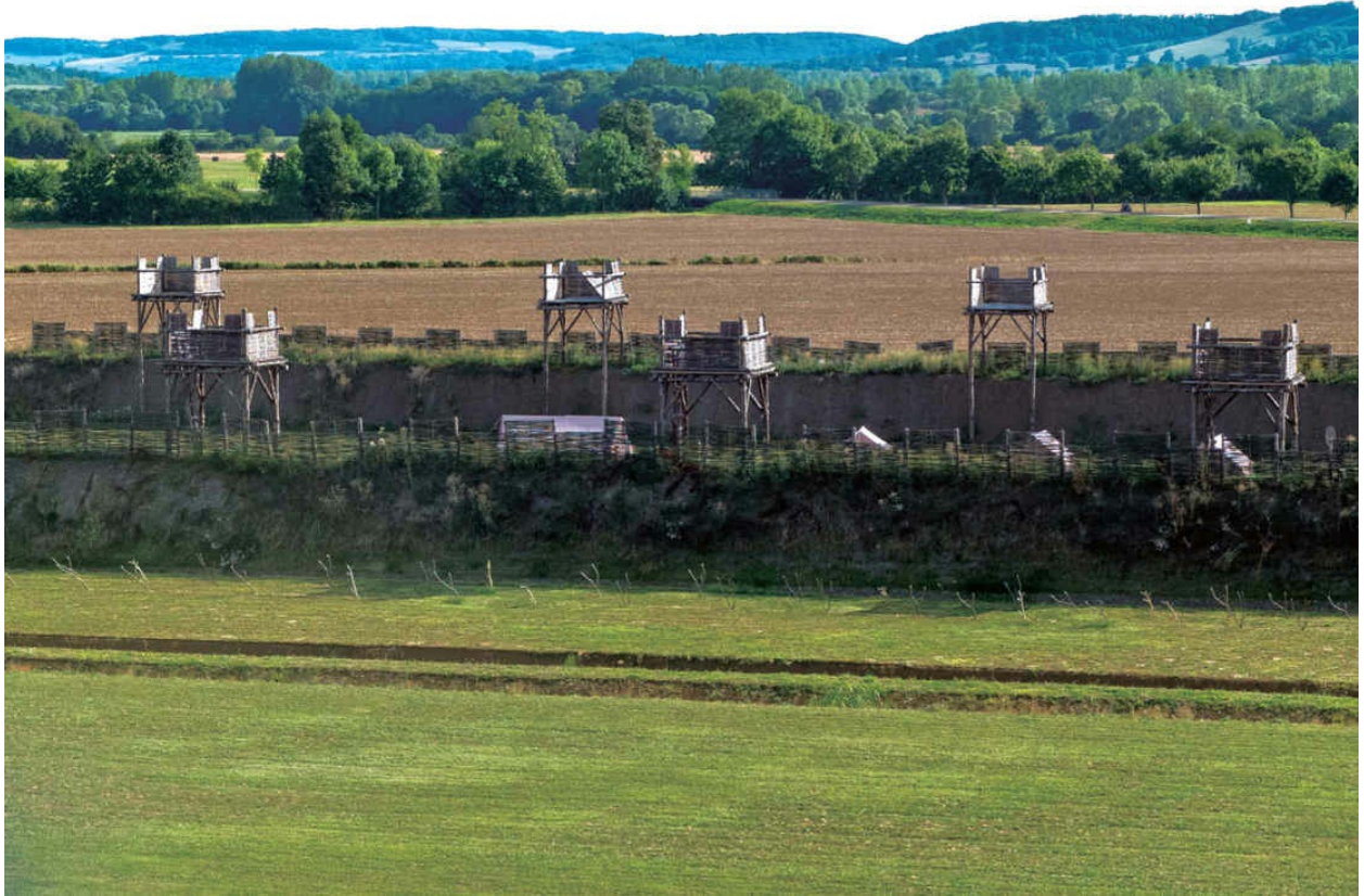
阿莱西亚攻防战时恺撒修筑的围城工事（重建后），法国勃艮第地区。