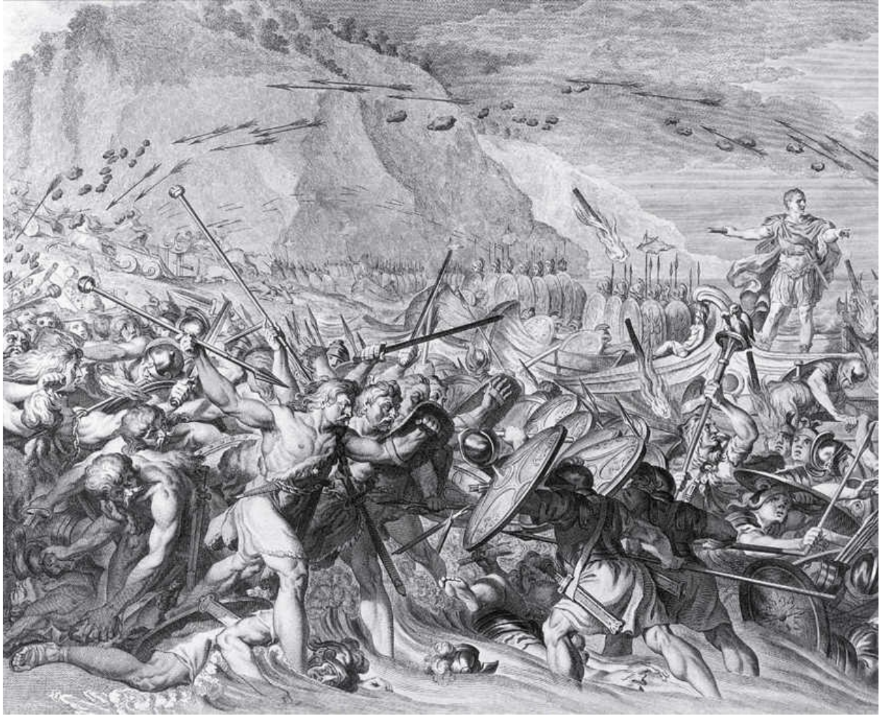
公元前55年，尤利乌斯·恺撒登陆不列颠。