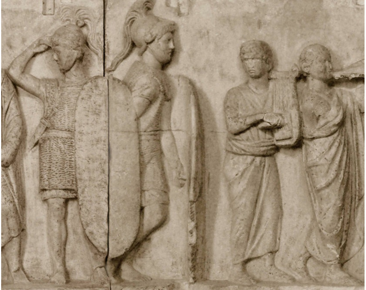
多米提乌斯·阿赫诺巴尔布斯纪念碑建于前1世纪，是该时期留存至今的少数详细描绘罗马士兵的图像之一，恺撒军团的士兵制服应当与图中类似：蒙泰福尔蒂诺式头盔、椭圆形盾牌和链甲。（Musée du Louvre）