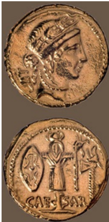
尤里乌斯·恺撒时期的罗马金币（复制品），为了庆祝恺撒在高卢战争中取得胜利，铸造于公元前 48 ~前 47 年。正面可能是维纳斯的头像，反面为缴获的高卢人武器。