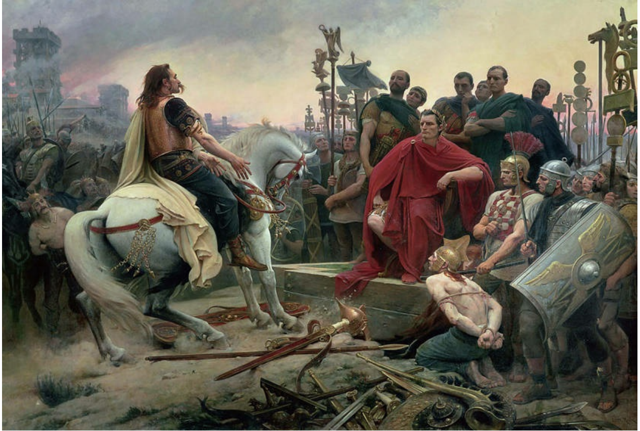
在尤利乌斯·恺撒脚下，维钦托利丢下武器》， Lionel Royer, 1899 。这幅画描绘了阿莱西亚攻防战后高卢人首领投降的情景。注意一名武士（左下角）戴有金属项圈。然而，事实上，只有神和皇室家族成员才有资格佩戴。画中对高卢人长头发、长胡须的描绘在今天看来也是有问题的。作者笔下维钦托利所骑的马属于佩尔什马，但是当时的高卢地区并不存在此种马。另外，图中的挽具和马鞍也不符合历史事实，因为这一时期高卢人骑马并不使用马鞍。依据历史记载，当时士兵多配以椭圆形盾，而不是图中的矩形盾。（ Musée Crozatier ）